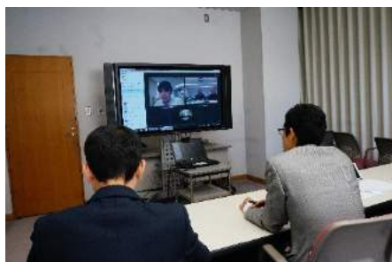
コンピューター・ネットワークに関する意見交換会(於：TV会議 平成28(2016)年11月1日)