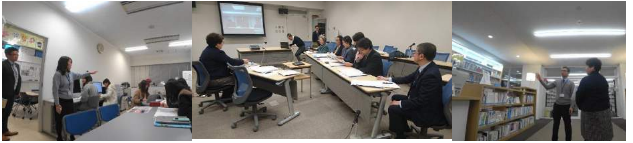
第3回相互交流連絡会(於：TV会議 平成29(2017)年12月18日)