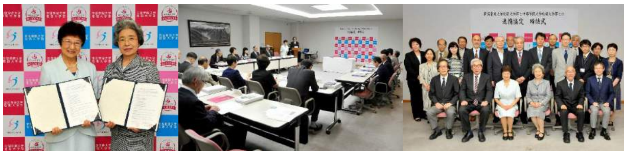
連携協定式(於：中部学院大学関キャンパス 平成 28 (2016) 年 9 月 20 日)